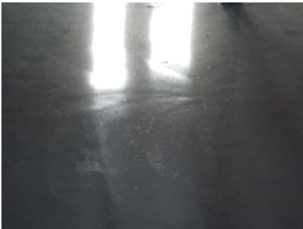
Figuur 5.3: Voorbeeld spanslag