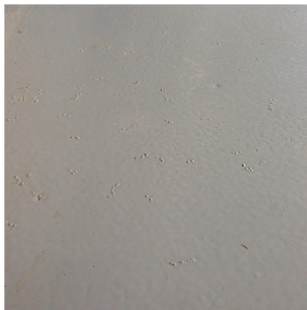
Figuur 5.2: Uitstekende delen in de coatinglaag