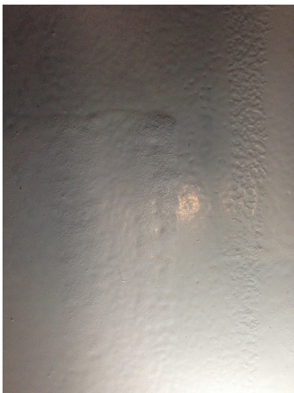
Figuur 5.5: Textuurverschil