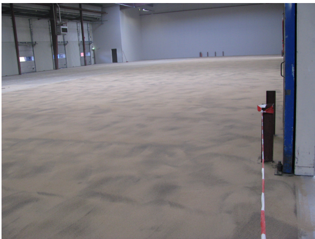
Figuur 5.4: Onregelmatige dekking met als resultaat vlekkerig beeld

Een onregelmatige dekking van de instrooilaag mag niet voorkomen. Er mag geen vlekkerig beeld waarneembaar zijn.