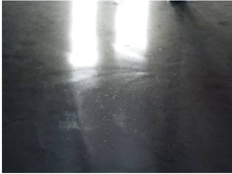
Figuur 5-7 Voorbeeld spaanslagen.