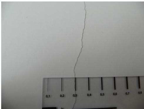
Figuur 5-12 Voorbeeld scheur.