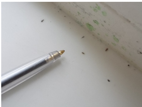
Figuur 5-8 Voorbeeld verontreiniging door vliegen.

Opmerking Deze eis houdt in dat als er insecten terecht zijn gekomen in de gietvloer, deze eerst verwijderd moeten worden. Na eventueel corrigerende maatregelen aan de gietvloer in verband met de verwijderde vliegen mag pas met het aflakken worden begonnen. Voor het aantal insecten in de kunstharsgebonden gietvloer na het aflakken is geen beoordelingscriterium vastgelegd.