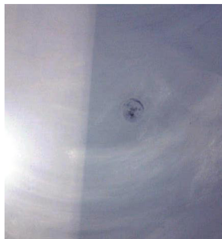
Figuur 5-3 Voorbeeld visooog.

Zogenaemde visogen mogen niet voor komen in de kunstharsgebonden gietvloer.