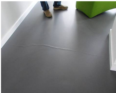
Figuur 5-13 Voorbeeld ader.

Of en waar een dekvloer gaat scheuren is doorgaans lastig te voorspellen. Het ontstaan van scheuren kan worden beperkt door krimpnaaden of dilataties aan te brengen in de dekvloer (ondergrond). Het is raadzaam om bij vloerverwarming en/of vloerkoeling het opstook- dan wel afkoelprotocol ten minste één keer te doorlopen alvorens de kunstharsgebonden gietvloer aan te brengen.