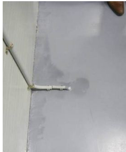
Figuur 5-14 Voorbeeld uitloop pigment.

Uitloop van pigment mag niet voor komen in de woningbouw. In andere sectoren is uitloop ook niet toegestaan, behoudens langs randen en andere obstakels in de vloer. De uitloop mag zich in dat geval niet breder uitsteken dan 20 mm vanaf de rand of het obstakel.