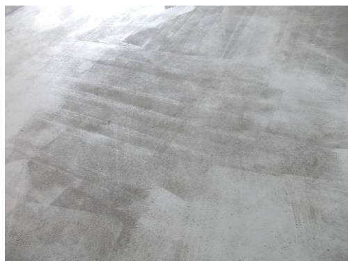
Figuur 5-10 Voorbeeld banen.

Een hoogteverschil groter dan 0,1 mm tussen overgangen van rollerbanen is niet toegestaan. Deze eis geldt niet bij dagnaden of overgangen welke bijvoorbeeld zijn gescheiden door het plaatsen van tape.