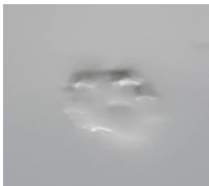
Figuur 5-5 Voorbeeld oneffenheden.