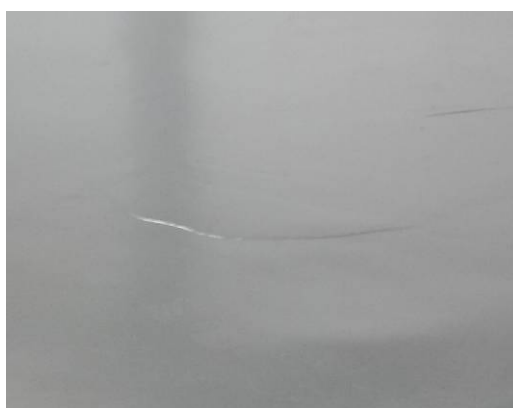
Figuur 5-6 Voorbeeld spaanslag.