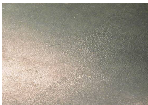
Figuur 5-11 Voorbeeld banen.