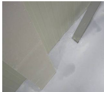
Figuur 5-15 Voorbeeld uitloop.