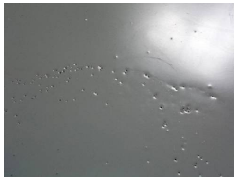
Figuur 5-1 Voorbeeld pinholes.