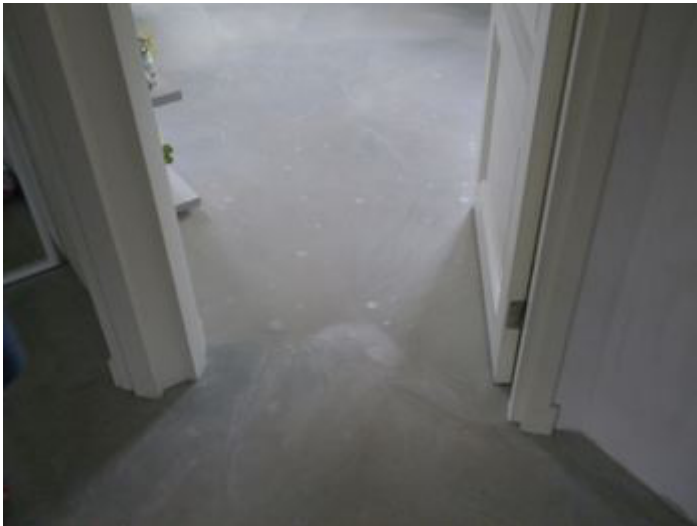
Figuur 5-16 Voorbeeld vlekken.

Vlekken ontstaan door of tijdens het aanbrengen van de kunstharsgebonden gietvloer als gevolg van de verwerking mogen niet voor komen. Hieronder ook te verstaan het aanwezig zijn van kringen door zweetdruppels. Aan het zichtbaar zijn van kringen of vlekken ontstaan door vochtbelasting direct na het aanbrengen van de kunstharsgebonden gietvloer is geen beoordelingscriterium gekoppeld.