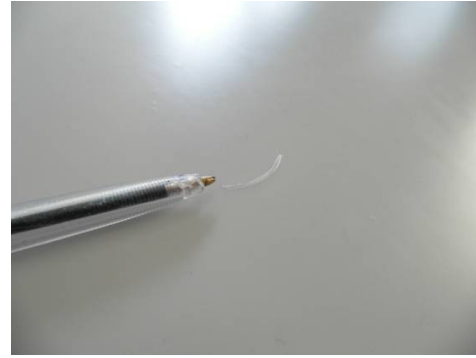
Figuur 5-9 Voorbeeld haar in gietvloer.